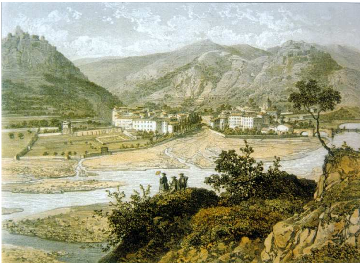
>>> Gravure représentant Puget-Théniers dans l'ouvrage « Nice et Savoie » de 1864. Bien que d'une époque récente, Puget-Théniers est ici plus proche de la ville médiévale que de la ville contemporaine. En haut à gauche, on devine le site de l'ancien château.